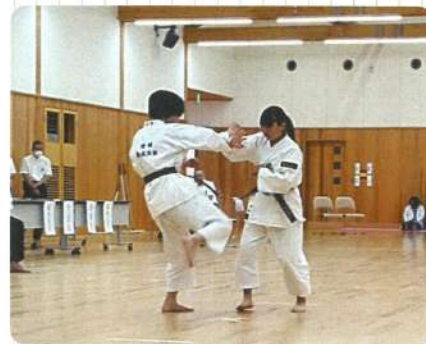
社会活動部(少林寺拳法)