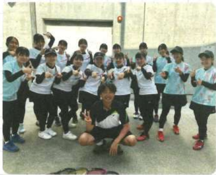
女子ソフトテニス部