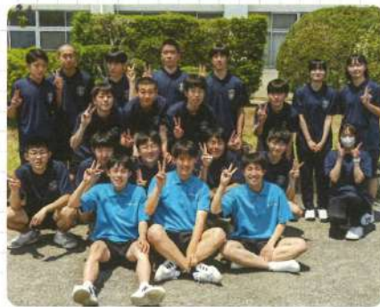
男子バレーボール部