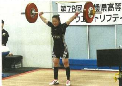
社会活動部(ウェイトリフティング)