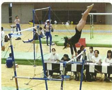
社会活動部(体操競技)