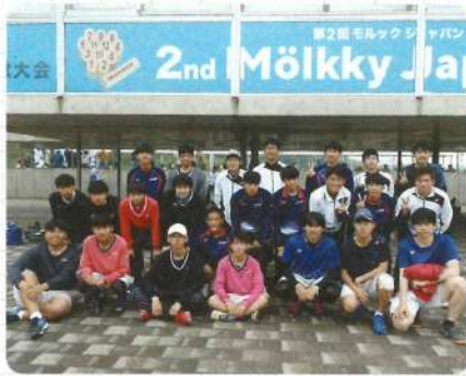
男子ソフトテニス部